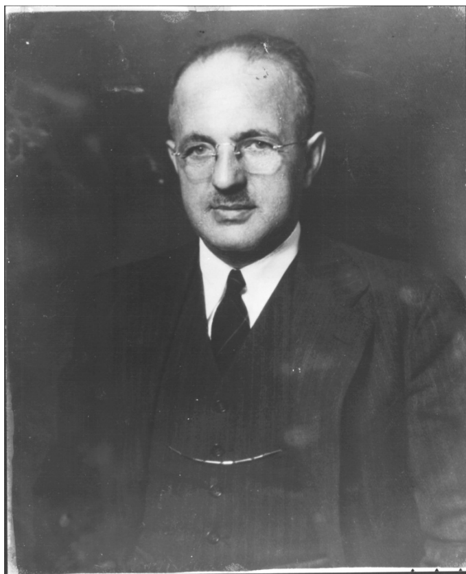
Гарри Декстер Уайт 1892 – 1948